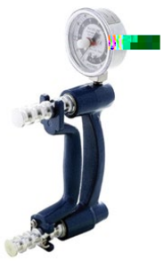
JamarH andG ripD dnamometer